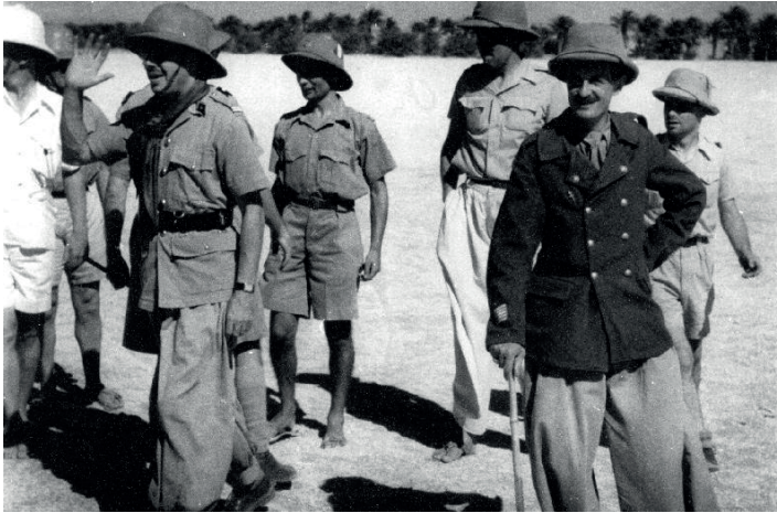
Le capitaine Leclerc et ses hommes à Koufra. Musée. Fonds FMLH.