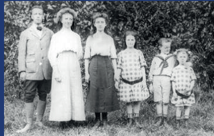
Philippe de Hauteclocque et ses frères et sœurs dans les jardins du château familial.