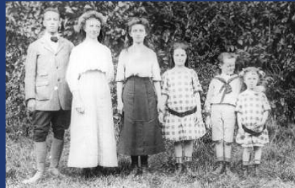
Philippe de Hauteclocque et ses frères et sœurs dans les jardins du château familial.